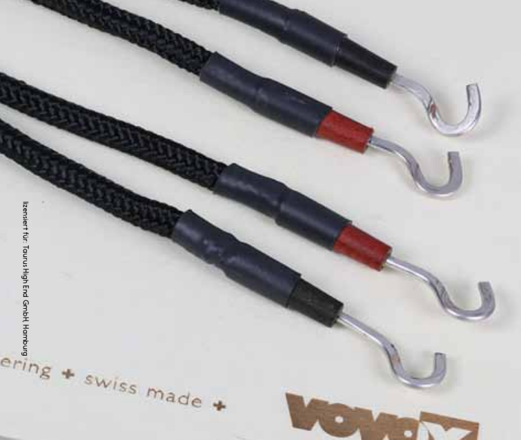
Isoliert für Taurus High End GmbH Hamburg

richtig grübeln, mitunter lustige 3-D-Radien im Voraus hindengeln, um die Haken dann wirklich bombensicher zu verschrauben. Wie schön, dass mir der Solution 530 mit seinen XXL-Terminals noch zur Verfügung steht. Wenn man zudem weiß, dass diese beiden Schweizerprodukte gemeinsam entwickelt wurden, wirkt die tatsächlich bombenfeste Symbiose aus Haken und Öse (Schraubterminal) fast schon wie eine Kaltverschweißung.